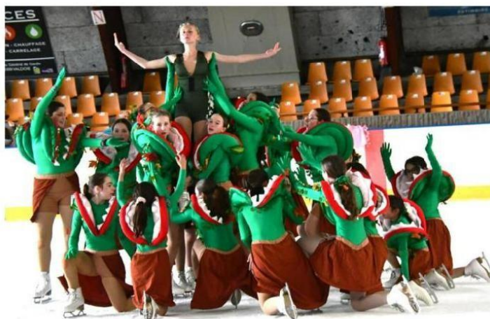
Les patineurs de l'ASM Belfort danse et ballets sur glace répètent un spectacle entre contes connus et créations originale.

Une cinquantaine de parents bénévoles se sont mobilisés