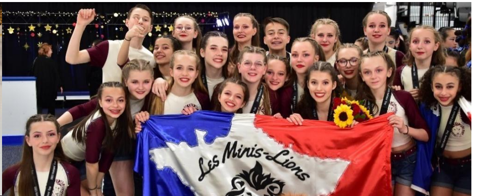
Les Minis-Lions, équipe Novice Vice-Champions du Monde en 2023 à Boston