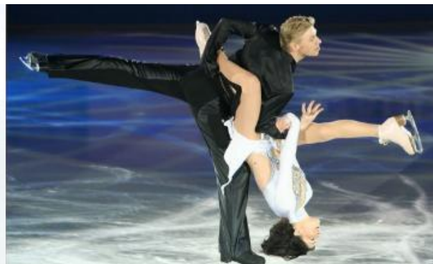
Isabelle DELOBEL et Olivier SCHOENFELDER