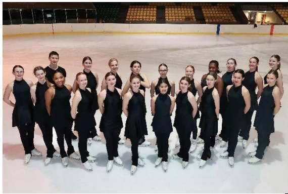
Les Crazy Lion's, équipe Open 1 er à la Gold Cup 2024 à Bordeaux