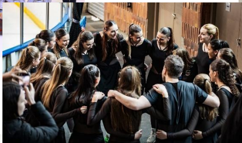
Dépassement de soi